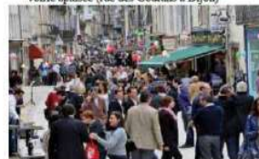
voirie apaisée (rue des Godrans à Dijon)

Concernant les aspects formels, il est nécessaire de se référer aux cahiers de prescriptions thématiques "matériaux et couleurs" et "mobiliers urbains".